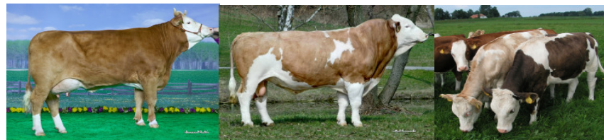
Roch - dochter IRIS