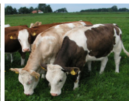
Roch - dochter IRIS 28 kg melk als vaars